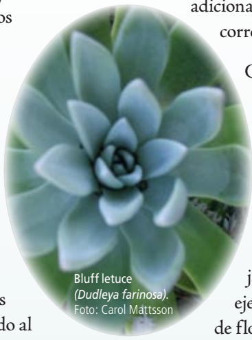
Bluff lettuce ( Dudleya farinosa ).

Usted puede observar plantas nativas en los bosques nacionales, parques estatales, viveros especializados, jardines botánicos y reservas naturales, como también en algunos libros y páginas electrónicas de Internet. Entre los jardines botánicos abiertos al público están: East Bay Regional Park District's Botanic Garden, el Rancho Santa Ana Botanic Garden, Santa Barbara Botanic Garden, UC Santa Cruz Arboretum, y UC Berkeley Botanic Garden. Algunos de los viveros convencionales y jardinerías ahora ofrecen plantas nativas debido al interés del público. Si usted no encuentra la planta que busca, pregunte por ella por su nombre.