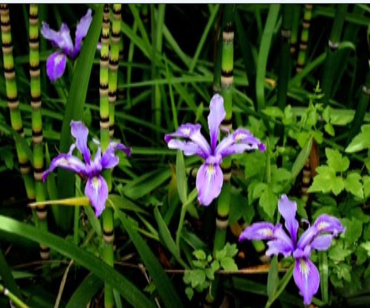
Lirio ( Iris douglasiana ), canutillo ( Equisetum arvense ), barba de chivato ( Clematis ligusticifolia ).