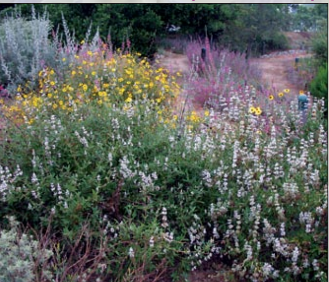
Un hermoso borde mixto con salvias nativas, Encella y Clarkia en el Golden West College Native Garden.

Utilice en su jardín plantas que requieren poca agua. Una vez establecidas, muchas plantas nativas de California consumen muy poca agua de riego. Ahorrando agua se ahorra dinero y a la vez se conserva un recurso vital limitado.