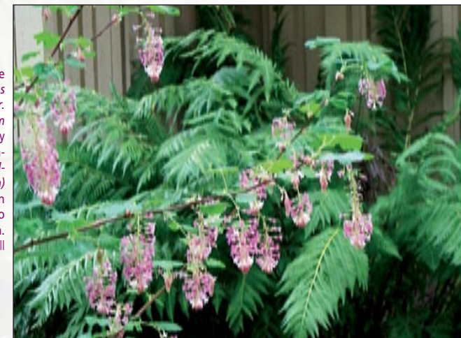
Flores rosadas de ciruelillo ( Ribes sanguineum var. Glutinosum 'claremont') y helecho gigantesco ( Woodwardia frimbiata ) en el Jardín Botánico Rancho Santa Ana.