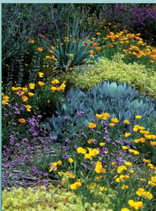
Dudleya en flor ( Dudleya virens ssp. hassei ) y bear grass ( Nolina parryi ssp. wolfii ) añaden textura y forma a su jardín.

Visite un proveedor de plantas nativas. Su capítulo local de CNPS es una excelente fuente de sugerencias de