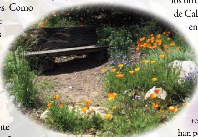
Un jardín relajante con amapolas doradas y gramíneas nativas en el Jardín Botánico de Santa Barbara.

Las plantas nativas tienen defensas naturales propias contra muchas plagas y enfermedades. Como la mayoría de los pesticidas matan indiscriminadamente, los insectos benéficos son igualmente exterminados. La reducción de pesticidas permite que el control de plagas sea natural y que se reduzca la contaminación de ríos y cuencas.