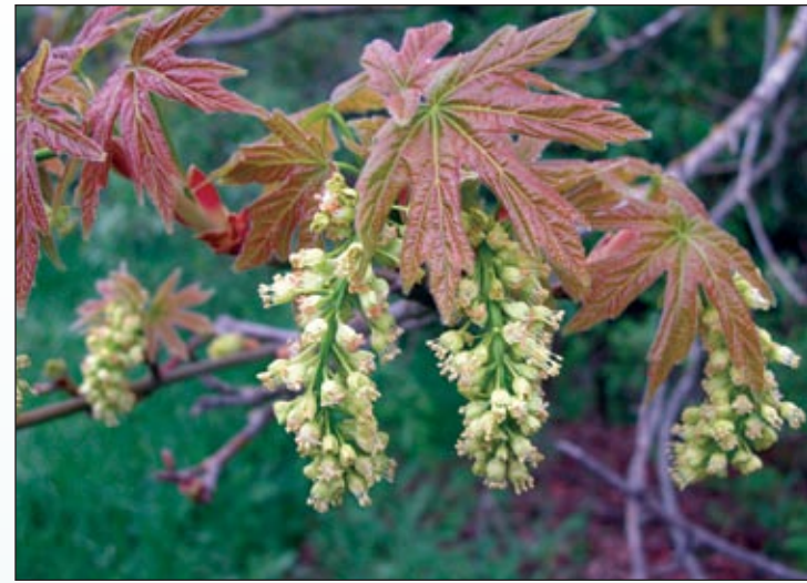
Crecimiento nuevo del bigleaf maple ( Acer macrophyllum ).

Una vez establecidas (dos a cinco años), muchas plantas nativas sobreviven con muy poca agua adicional. Al comienzo puede ser un reto determinar la cantidad adecuada de agua para sus plantas nativas. La escasez de agua es la causa más común de muerte de las plantas jóvenes y el exceso de agua pudre las raíces y causa la muerte de las plantas ya establecidas. Algunas especies nativas pueden mantenerse saludables durante el año con solo regarlas de una a cuatro veces por mes. Verifique con un experto los requisitos de agua.