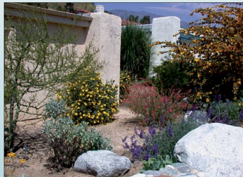
Un colorido jardín en el sur de California con flores de arbustos como flannelbush ( Fremontodendron sp.) y island bush poppy ( Dendromecon harfordii ).