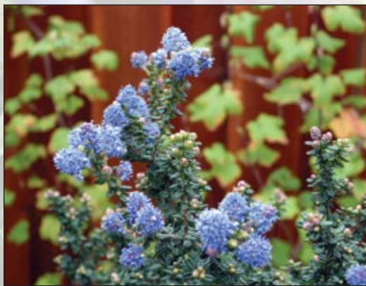
California wild lilac ( Ceanothus impressus ).

Aunque las plantas nativas de California han decorado los jardines en todo el mundo durante más de cien años, la mayoría de nuestros jardines no reflejan la belleza y esplendor natural por los que California es famosa. Cultivando plantas nativas usted podrá gozar de la belleza paisajística de California en su propio jardín además de obtener muchos otros beneficios.