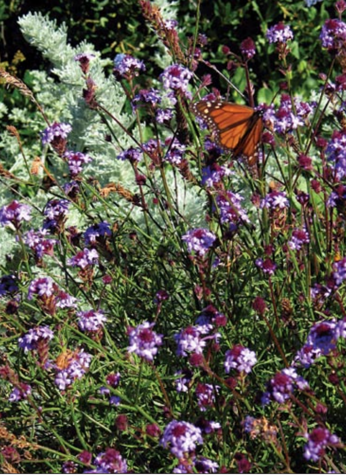
Mariposa monarca sobre lilac verbena ( Verbena lilacina ) con sandhill sagebrush ( Artemisia pycnocephala ) atrás.